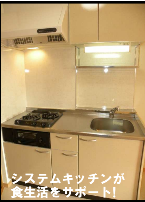
システムキッチンが食生活をサポート！

■ファボーレ大宮 ◆所在地/大崎市古川大宮6丁目3-3 ◆交通/JR古川駅より徒歩40分 ◆構造/木造2×4工法2階建 ◆総戸数/全10戸 ◆間取り/1K ◆面積/27.32㎡ ◆築年/2009年8月 ◆設備/シャブドレッサー TVモニターホン・暖房洗浄機能付トイレ エアコン・給湯器・下駄箱システムキッチン 照明・物置・BS・Bフレッツ 【募集条件】 ◆賃料/38,000円 ◆共益費/2,000円 ◆駐車場/3,000円 ◆町内会費/500円 ◆敷金/なし 礼金/なし ◆契約形態/普通賃貸借契約2年 ◆更新料/賃料の1.08ヶ月分(税込) ◆仲介料/賃料の0.54ヶ月分(税込) ◆その他/家賃保証会社利用 家財保険加入2年間15,000円 法人契約の場合 上記同じ ※4月中旬入居可能