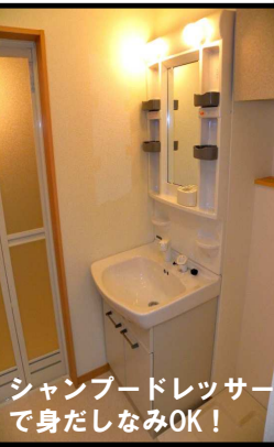
シャブドレッサーで身だしなみOK！