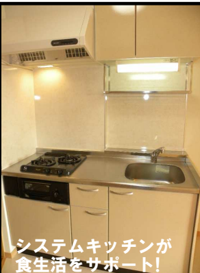
システムキッチンが食生活をサポート！

■ファボーレ大宮 ◆所在地/大崎市古川大宮6丁目3-3 ◆交通/JR古川駅より徒歩40分 ◆構造/木造2×4工法2階建 ◆総戸数/全10戸 ◆間取り/1K ◆面積/27.32㎡ ◆築年/2009年8月 ◆設備/シャンプードレッサー TVモニターホン・暖房洗浄機能付トイレ エアコン.給湯器.下駄箱システムキッチン 照明.物置.B.S・Bフレッツ.駐車場1台付 【募集条件】 ◆賃料/43,000円 ◆敷金/なし 礼金/なし ◆町内会費/500円 ◆契約形態/普通賃貸借契約2年 ◆更新料/賃料の1.08ヶ月分(税込) ◆仲介料/なし ◆その他/家賃保証会社利用 家財保険加入2年間15,000円 法人契約の場合 上記同じ ※4月中旬入居可能